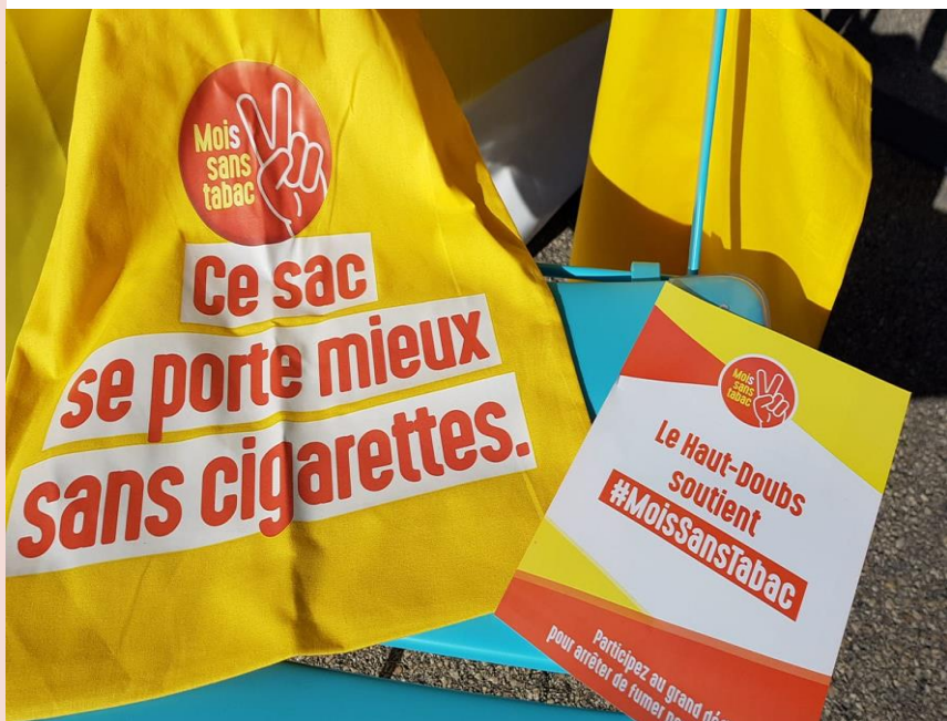
Outils de communication, Santé Publique France