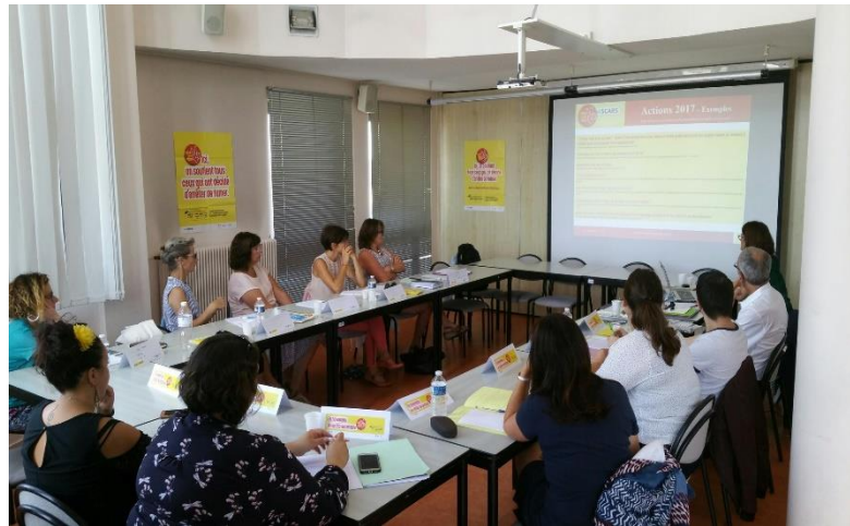
Journée départementale, Nevers